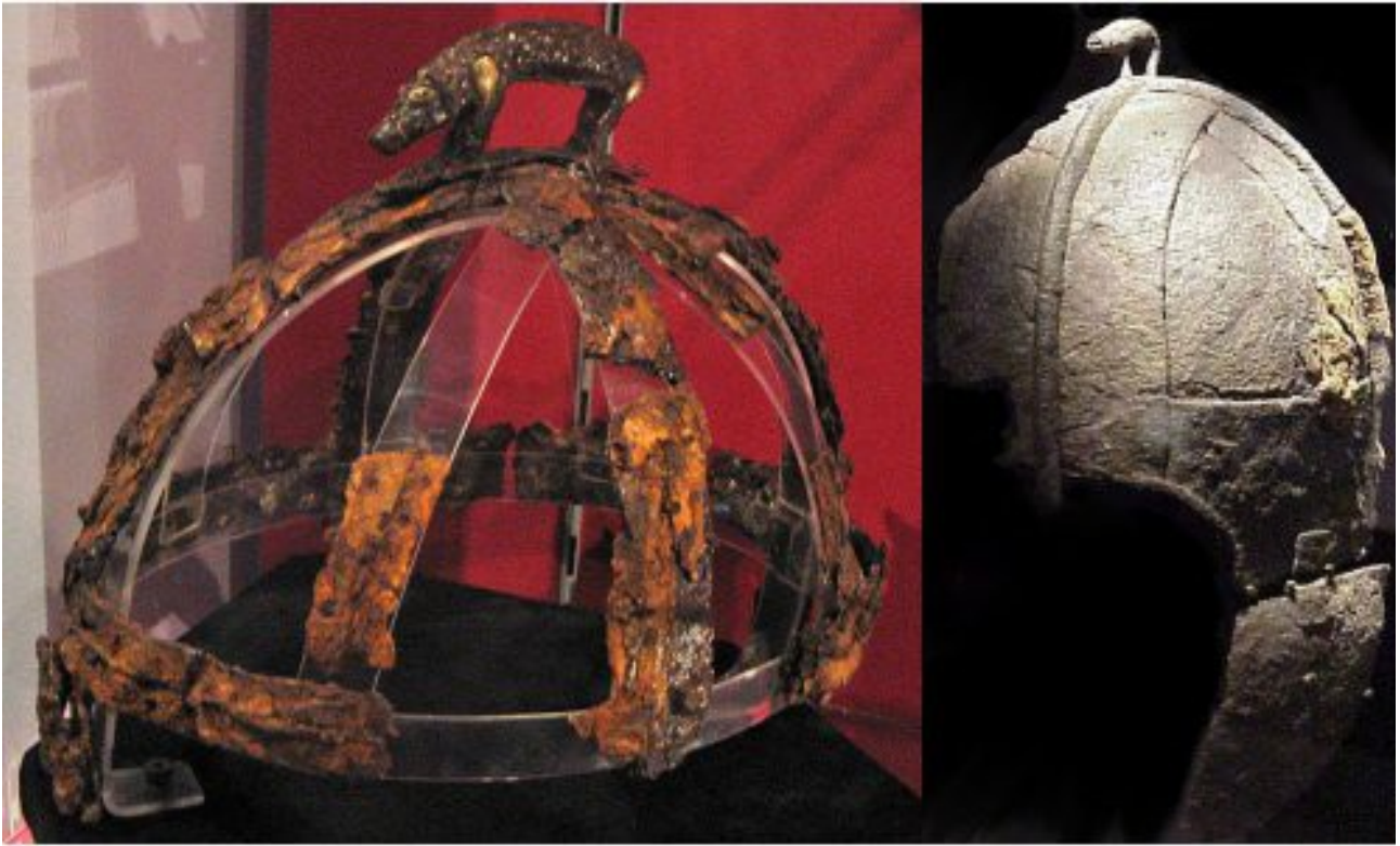
Saské přilby z Benty Grange (vlevo) a Wollastonu (vpravo) s kanci na hřebec. Obrázky převzaty z Wikipedie.

Zatímco válečníci využívali kance jako symbolu poměrně hojně, s kančími trofejemi se nezacházelo vždy stejně. V pohanských saských hrobech se nachází značné množství kančích zubů, pro něž je společné několik málo znaků: