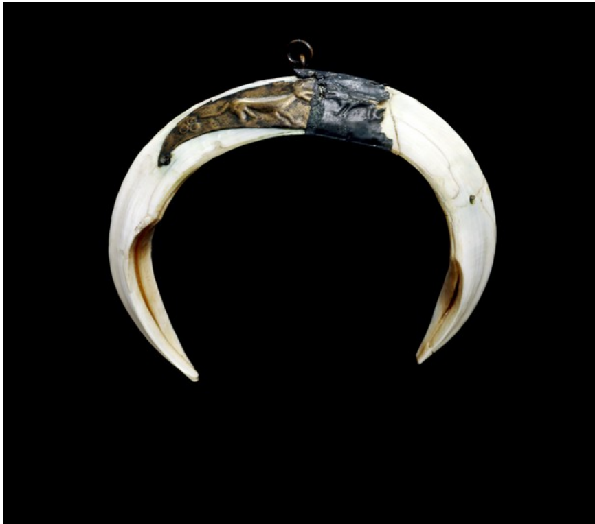
Kančí kly osazené bronzem z North Wraxall.

Tyto tradice odrážely praxi běžnou po zbytku Evropy. Jsou známa další podobná kování ze stejného období, zejména pak byla používána germánskými žoldáky (MacGregor 1985, str. 109) a byla interpretována jako kování štítů, přileb či dokonce jako součást jezdeckého vybavení (Meaney 1981, str. 133).