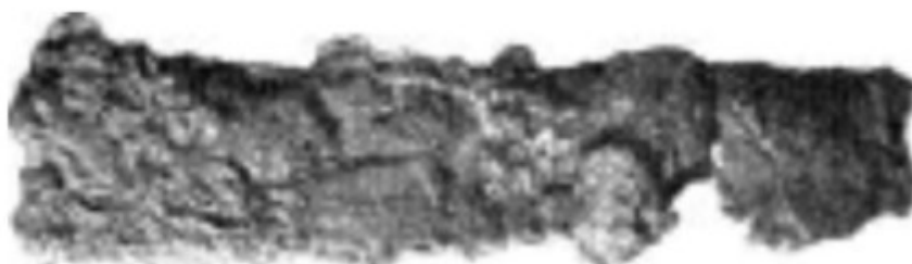
Borkovský 1946: Obr. 3.6.

Na III. nádvoří Pražského hradu byl roku 1928 objeven hrob bojovníka, umístěný 50 cm pod povrchem. Jáma o rozměrech 292 × 154 × 78 cm byla opatřena výdřevou z dubových prken a byla překryta víkem z měkkého dřeva. U nohou kostry se nacházelo malé vědro, u pravé nohy pak meč a sekera. U levého boku se nacházely dva nože a kožený váček s křesadlem, kamínkem a břitvou. Břitva je dlouhá 11,8 cm, široká 2-3 cm a 0,6 cm tlustá, silně zkorodovaná. Čepelka byla uložena v charakteristickém pouzdře z ohnutého plechu ( Borkovský 1946: 126; Borkovský 1969: 136-7; Sláma 1977: 105 ). Datace směřuje do 2. pol. 9. či 1. pol. 10. století ( Hošek – Košta – Žákovský 2019: 218 ).