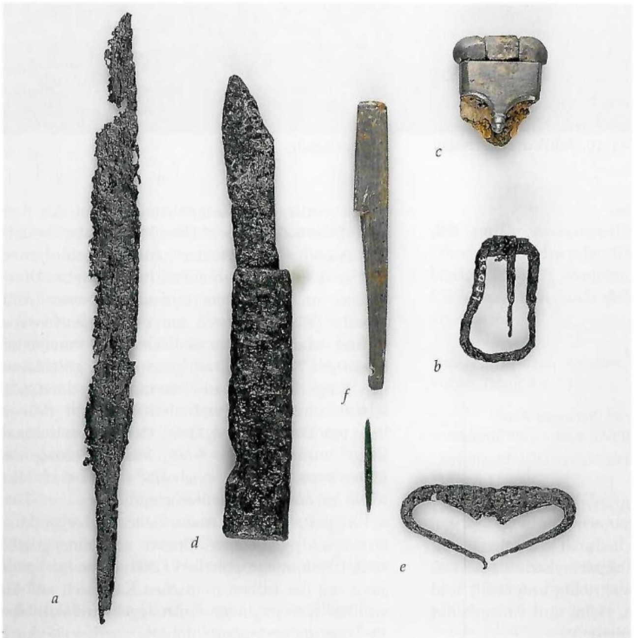
Zdroj: Puhle 2001: 260, IV. 52.