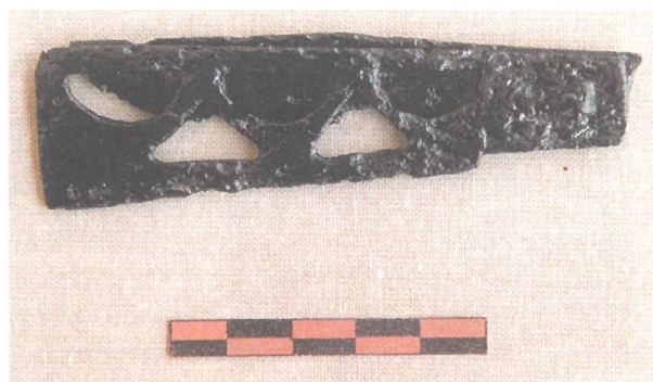
Jaworski 2005: Ryc. 146.